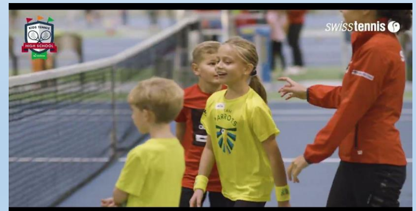
Kids Tennis High School