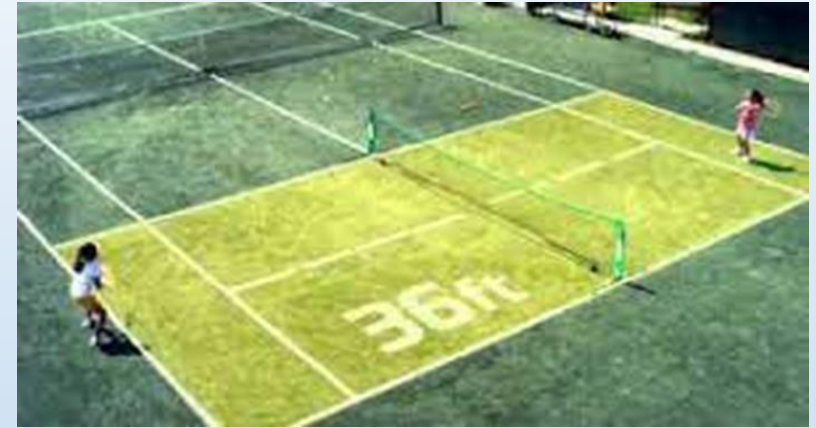
Tennis 10s - The Rules are Changing